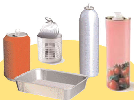
Conserves, canettes, aérosols, barquettes en aluminium

Bien vidés, sans les sacs et films plastiques